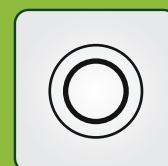
CZYTNIK KLUCZY DALLAS (opcja)