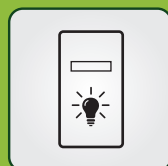
METALOWA, PODŚWIETLANA KLAWIATURA