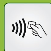
CZYTNIK KLUCZY ZBLIŻENIOWYCH (opcja)