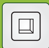
MONTAŻ PODTYNKOWY (opcja z ramką)